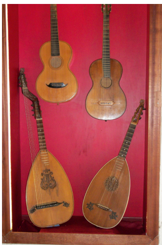
Mostra di Strumenti Popolari

Nei giorni dei concerti il Museo di Pianoforti Antichi, la Mostra di strumenti popolari ed il Parco sono visitabili con ingresso gratuito dalle 15.30 alle 19.