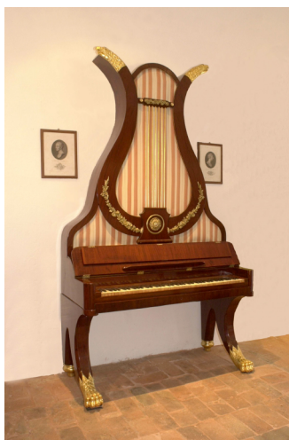
Museo di Pianoforti Antichi