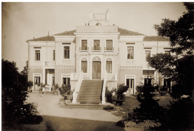
Villa Centanin (foto inizio XX sec.)